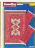
6283 Matset Balkan