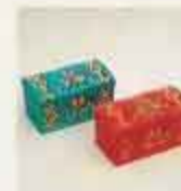
4400 Kista, blå 4401 Kista, röd