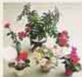
6605 Sex blommor