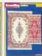
6284 Matset Bagdad