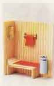
8860 Bastu m. lampa