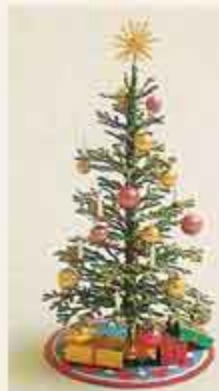
NYHET! 8981 Julgran En underbart vacker julgran, med julgransmatta.