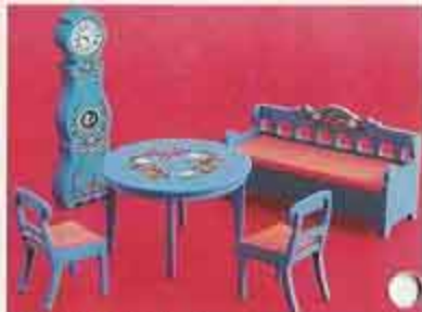
9321 Matsal i ljuslind 4403 Bord, två stolar, 4404 Stol 4405 Allmogesoffa 4415 Meraklocka