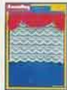
6340 Gardin Empire