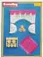
6320 Gardinet, kök