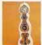
NYHET! 4364 Klocka Royal