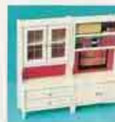
5381 Vitinskåp 5382 Bockhylla