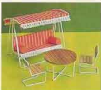
9803 Trädgårdsmöbel Hammock, trädgårdshord, två stolar (ej blisterpack)