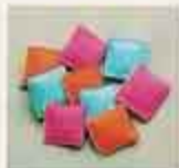
NYHET! 6610 Nio kuddar