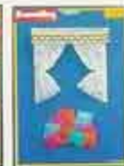
6350 Gardinet, varlängsrum