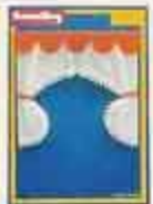
6330 Gardin, Grön