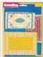
6282 Matset Desiree