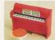
5464 Piano, vitt